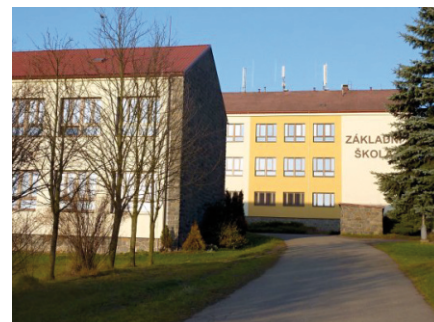
ZŠ Krucemburk, aktuální sídlo pobočky ZUŠ Chotěboř