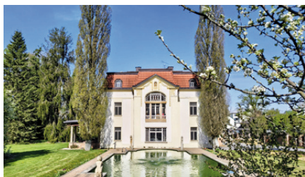
„Bílá vila“ Krucemburk, v minulosti sídlo LŠU

Dnes jsem si pro připomenutí historie naší školy vzala dřívější zlidovělou zkratku názvu Lidová škola umění (LŠU) . Ten název byl tak oblíbený, že se ještě dnes, i na úřadech, setkávám často s pozdravem „...á, Vy jste z té Lidušky“. LŠU změnila svůj název celostátně v roce 1980 na Základní umělecká škola .